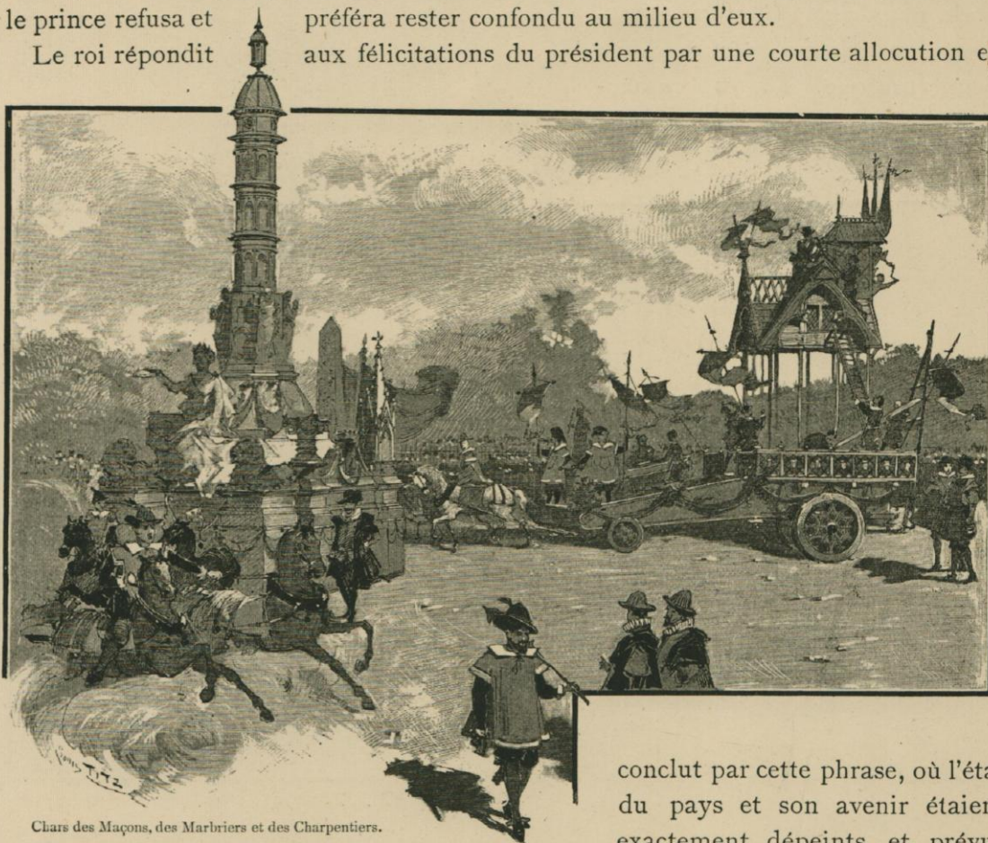
Clair des Maçons, des Marbriers et des Charpentiers.

aux félicitations du président par une courte allocution et